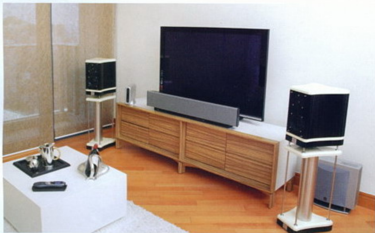
←50" 的 Samsung PS50Q7H 是為全屋的焦點所在，可供直接播放來自 Pixel Magic HD Media Box MB 100 的影片，主揚聲器是來自意大利的 Eventus Audio Metis 書架揚聲器。如果怕後置揚聲器的接線有礙觀瞻，Yamaha YSP-1000 的虛擬環繞聲反射相信可為你分憂，加上 YST-FSW100 超低音效果更為理想。器材眾多件，但只要一個 Logitech Harmony 885 Advanced Universal Remote 智能遙控就能輕鬆操作。