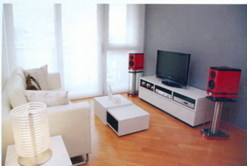
↑火辣辣的法拉利紅外飾使 Eventus Audio Metis 揚聲器輕鬆俘虜機迷芳心，廠方另備有法拉利黃外飾供用戶選擇。由於本空間以音響為主，所以就配上了一套 Creeks Classic CD 播放機及 Creeks Classic 5350 合併式擴音機，而電視方面則用上屏幕較小的 32" Samsung LA32M61B。