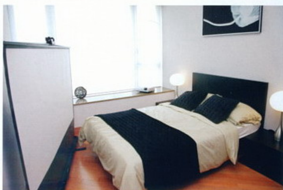
↑睡房看投影並非難事，有具備梯形矯正功能的 Epson EMP-S4 投影機，以及 Grandview Standble-Com 80 HD 16:9 地拉幕就能輕鬆達到。（本圖為設計圖片）